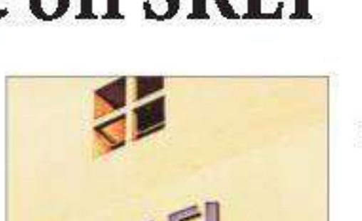
Two SREI group entities owe over ₹30,000 crore to banks and financial institutions

challenging the RBI's action. They said in the plea that the RBI had acted in haste and